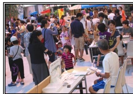
※昨年度の会場の様子です