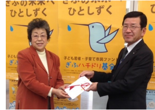
H26.3.25 NDS株式会社岐阜支店長様より、寄付金の目録をいただきました。

NDS株式会社の会社創立60周年を記念した社会貢献事業の一環として、地域に密着した活動を展開しているNPO等団体に寄付を実施するにあたり、岐阜県においてはぎふハチドリ基金を選んでいただきました。